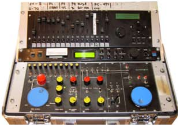
"the blue wheel instant composing machine" 1996-2008