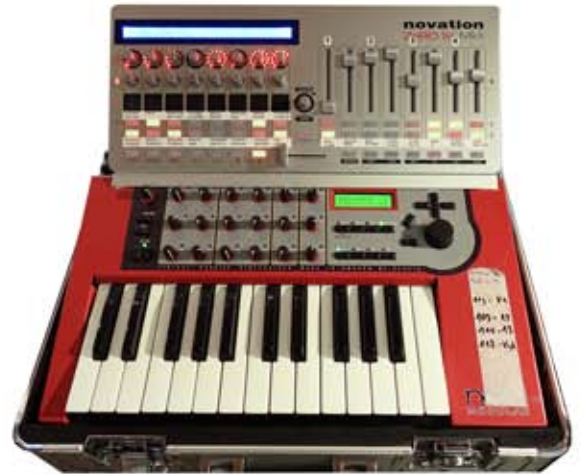
„the instant composing machine“ ab 2015

Klangerzeuger: Clavia Nordmodular 1 / EMU Ultra Proteus